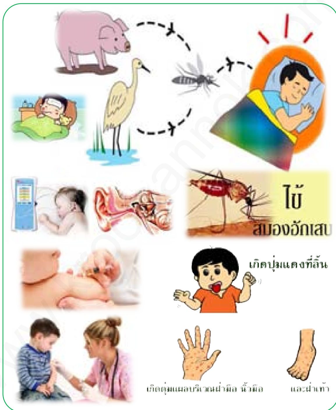
ภาพที่ 5 โรคไข้สมองอักเสบ