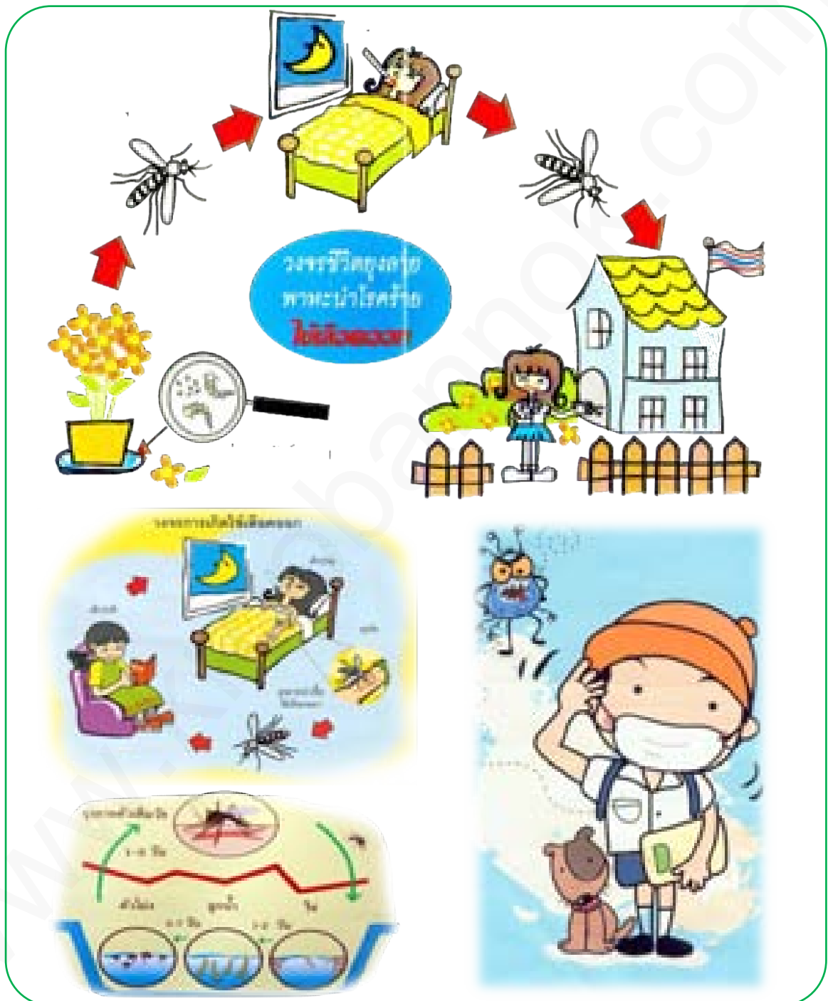
ภาพที่ 4 โรคไข้เลือดออก