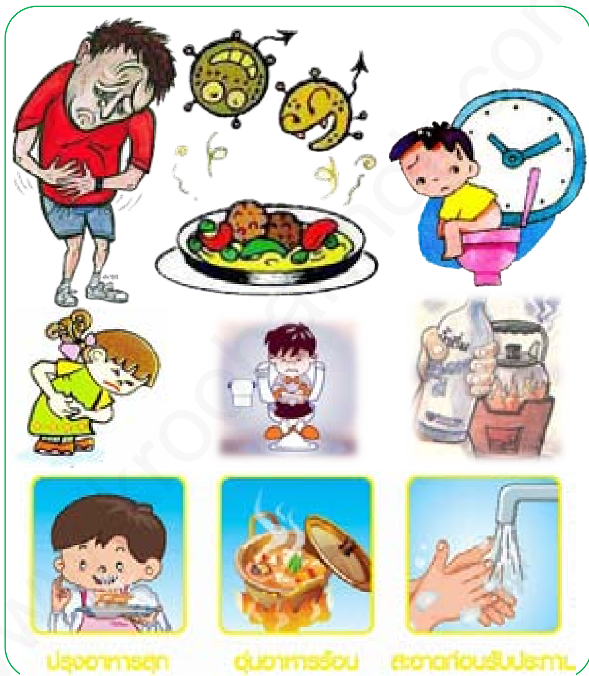
ภาพที่ 6 โรคอหิวาตกโรค