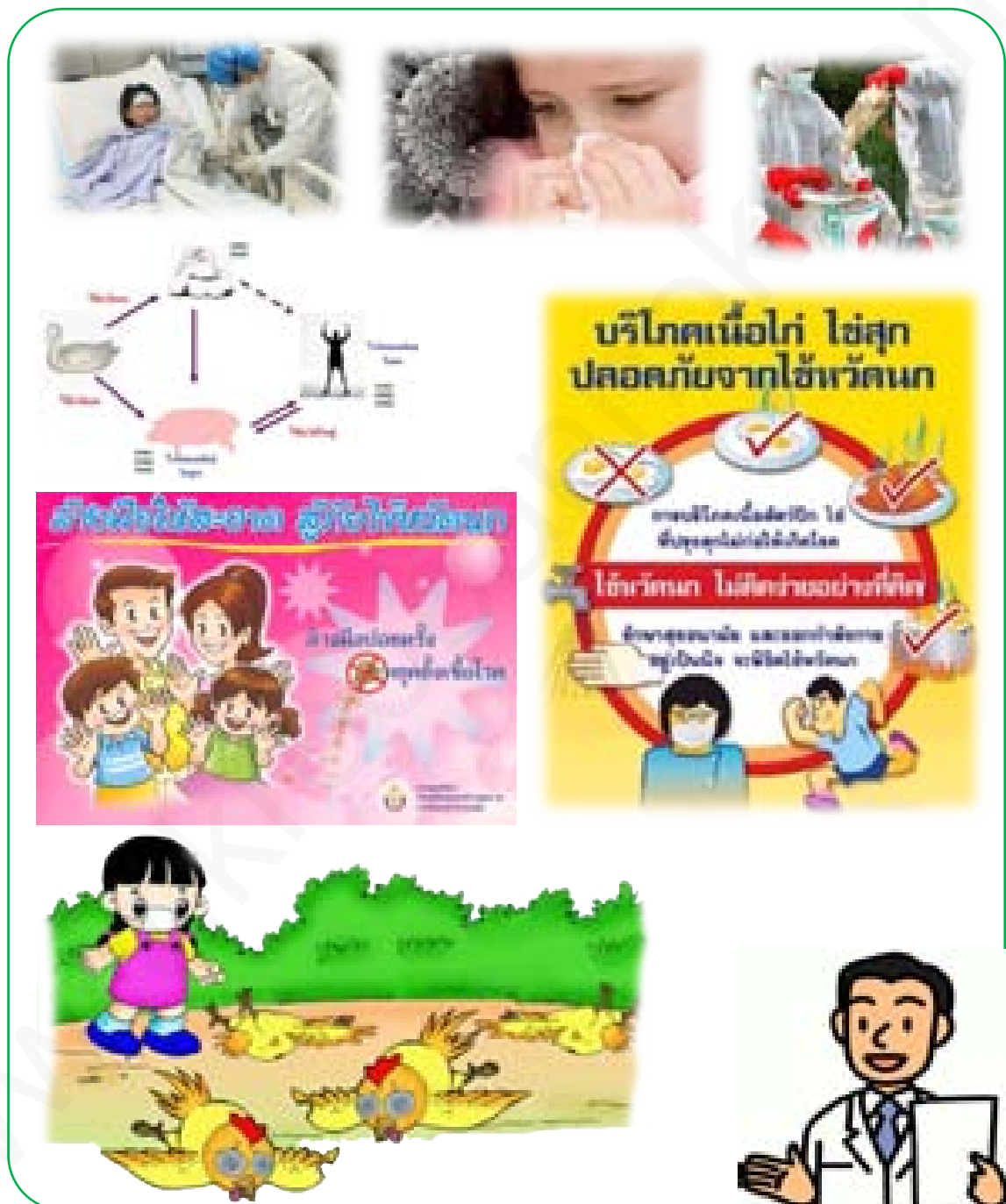
ภาพที่ 3 โรคไข้หวัดนก