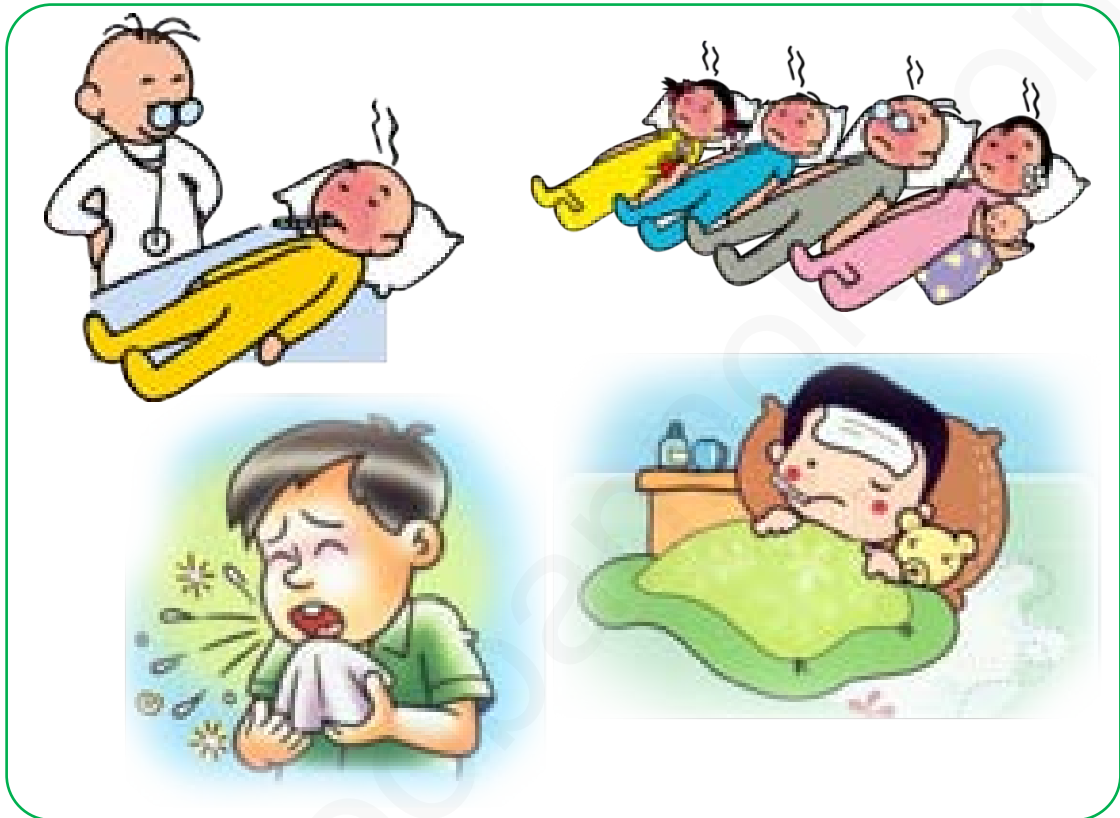
ภาพที่ 2 โรคไข้หวัดและไข้หวัดใหญ่

ที่มา : http://vcharkarn.com/varticle/39194